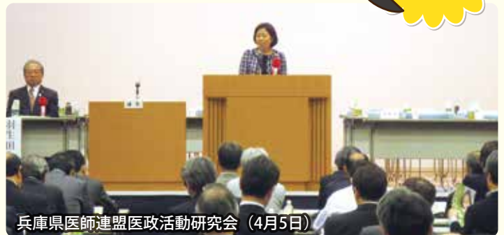
兵庫県医師連盟医政活動研究会 (4月5日)