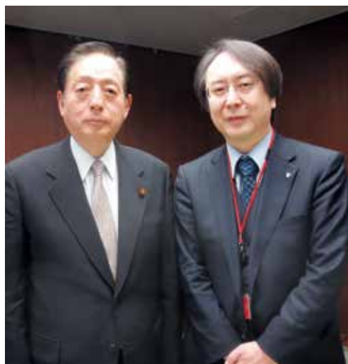
太田昭宏国土交通大臣 (左) と松原謙二副委員長 (4月1日)

面談では、国土交通省主催の「病院等を対象とするヘルスケアリークの活用に係るガイドライン検討委員会」において、現在検討されている「ヘルスケアリート」に関するガイドラインについて、「医療の非営利性」「地域の医療提供体制を堅持する観点」をガイドラインに明示するよう要望を行った。