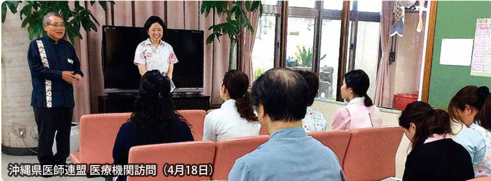
沖縄県医師連盟 医療機関訪問 (4月18日)