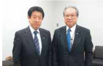
塩崎恭久厚生労働大臣(左)と羽生田たかし