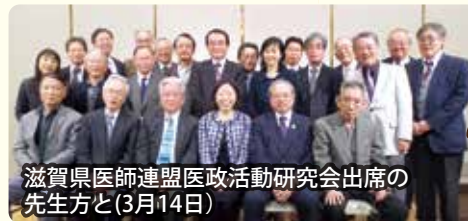
滋賀県医師連盟医政活動研究会出席の先生方と(3月14日)

※4月20日現在(紙面の関係で全ての会合をご紹介できませんことをお許しください)