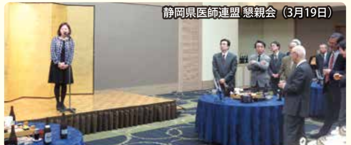
静岡県医師連盟 懇親会 (3月19日)