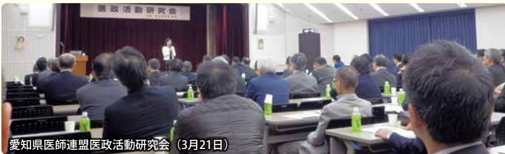
愛知県医師連盟医政活動研究会 (3月21日)