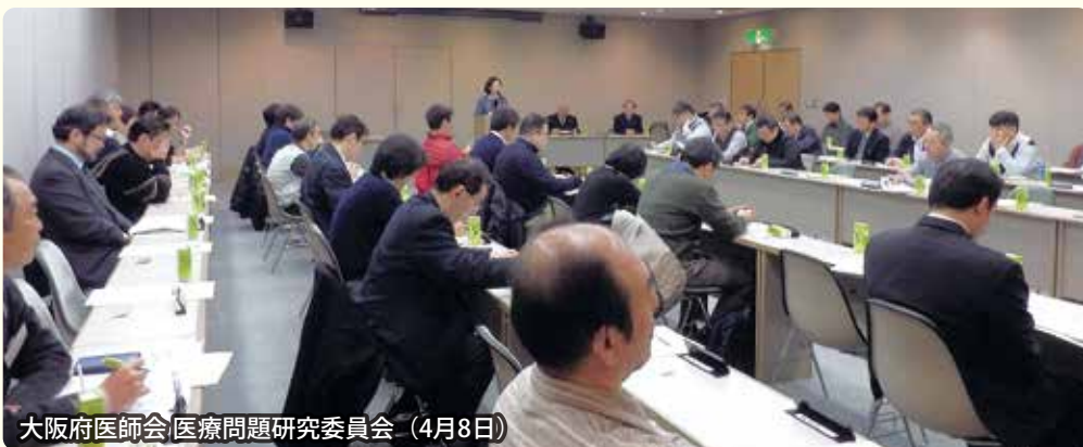
大阪府医師会 医療問題研究委員会 (4月8日)